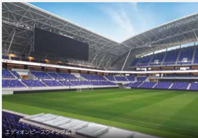
エディオンピーススウィング広島

は、まさに「平和」の象徴です。また、これこそ、スタジアムの有効な活用策であり、未来志向の平和行政だとも思うのです。