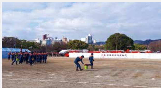
広島市消防の出初式でのひとコマ

消防行政への関心の高さを実感しました。消防団員は地域の「防災・減災」を担う、非常勤特別職の地方公務員です。各消防団の担当地域(主に小学校区)で災害や事故が起これば現場に急行し、消防職員(消防士)と住民の生命・財産を守るため身を挺します。まさに、地域の「安全・安心」を支える存在ですが、近年、消防団の「機動力」や団員の確保が課題となっています。