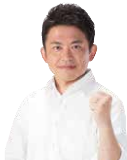
広島市議会議員 むくぎ 太一