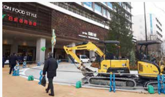
神戸・鈴蘭台駅ビル

広島市議会の「都市活性化対策特別委員会」で、1月27～29日の3日間、「再開発」をテーマに、大阪、京都、神戸の3都市を視察しました。神戸市北区の神戸電鉄・鈴蘭台駅の駅前地区再開発では、郊外型のまちづくりの観点から、広島市安佐南区で活かせるヒントがありました。